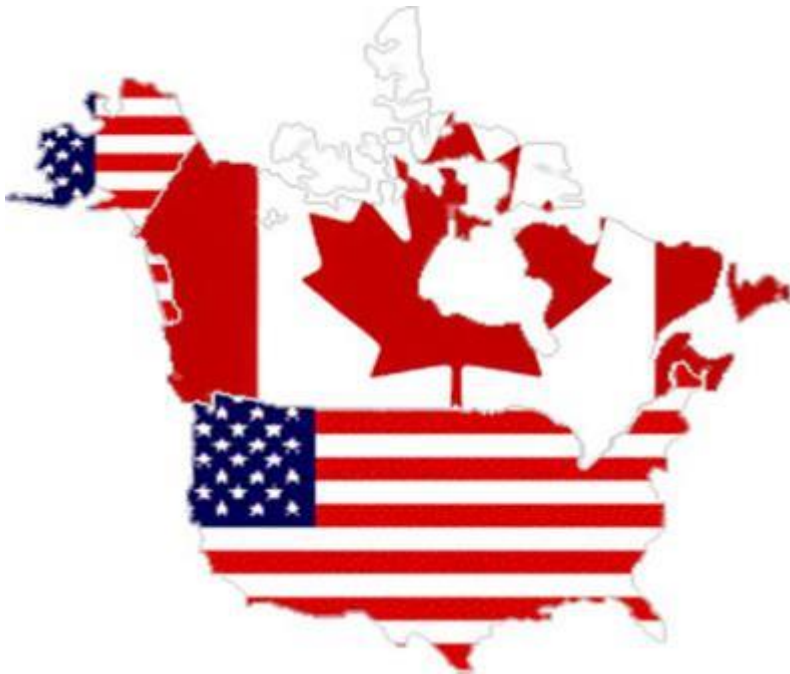
Рис. 2. Граница между США и Канадой

Территория – это часть земной поверхности с присущими ей антропогенными и природными ресурсами, условиями.